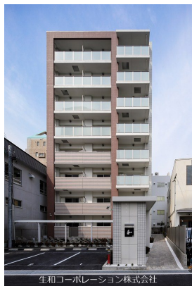
生和コーポレーション株式会社